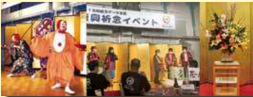
■ 郷土芸能(ひょっとこ、太鼓) ■ フラダンス ■ ベレダンス ■ 樽酒(鏡開き) ■ 盛花 ■ ステージタイトル