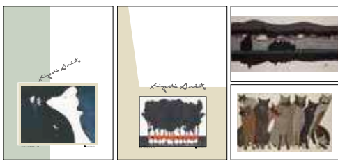
オリジナルグッズ