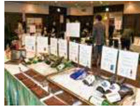
地元6蔵元をはじめ ワイン、ウイスキーも紹介