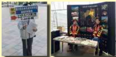
シャトルバス等への案内誘導や会場でのインフォメーションデスクなど