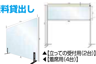
▲ [立っての受付用(2台)] ▼ [着席用(4台)]