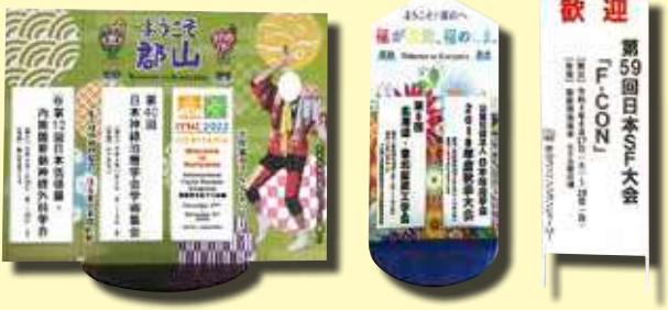
■ JR郡山駅(2F中央改札口付近) JR磐梯熱海駅(改札口付近)