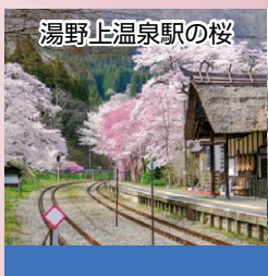
湯野上温泉駅の桜