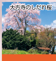
大方寺のしだれ桜