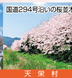
国道294号沿いの桜並木