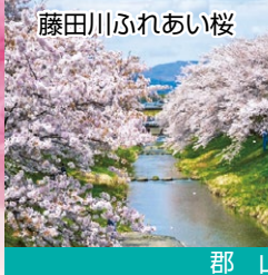
藤田川ふれあい桜