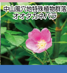
中山風穴地特殊植物群落 オオタカナバラ